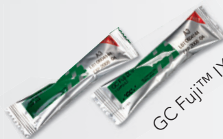
GC Fuji™ IX GP FAST