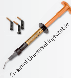
G-aenial Universal Injectable