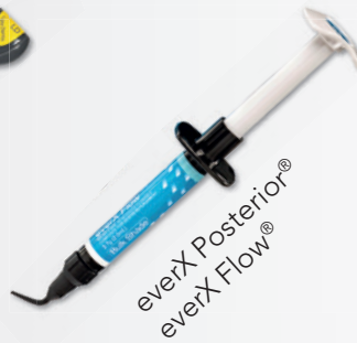
everX Posterior® everXFlow®