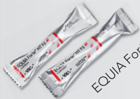
EQUJA Forte™ HT