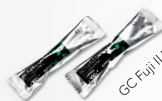
GC Fuji II LC